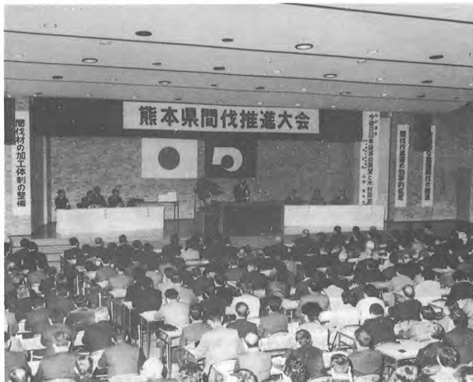
間伐材の有効利用の促進を

民有林の森林の区域を明確にして、伐採、造林、林道及び保安施設等、地域森林の整備に必要な目標計画を定めます。