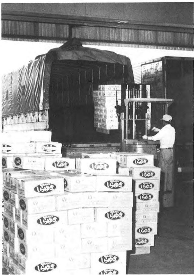
▶6月になると各地の産地からメロン、スイカが大都市の消費 地に出荷される(八代市郡築、鹿本郡植木町)