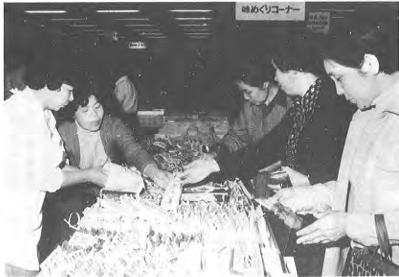
▲ふるさとを見直す「ふるさと祭り」

の振興、技術開発の推進、金融制度の拡充などを柱として次のような施策を推進します。