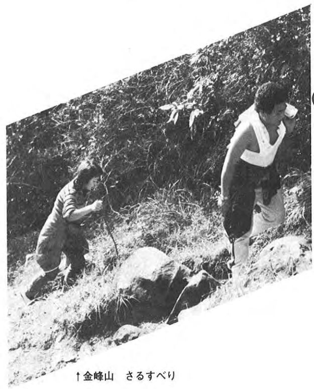
↑金峰山 さるすべり