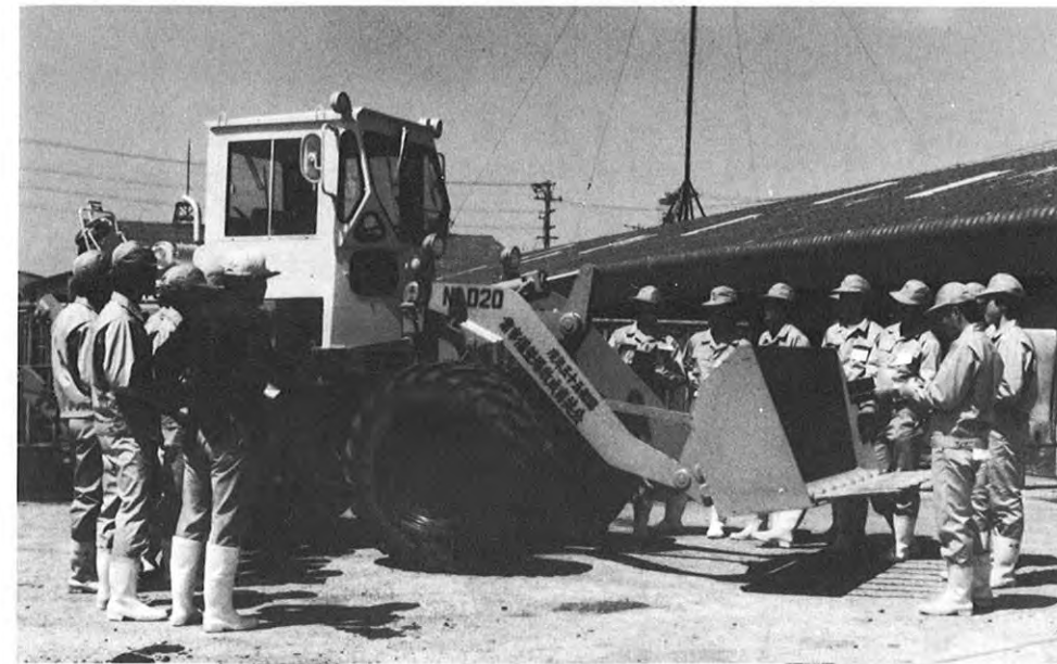
大型農業機械の実習