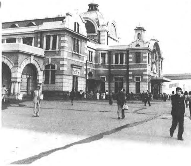
上から 新羅仏教芸術の粋とされる仏国寺 朝鮮王朝の正宮、景福宮 世宗路大通りと光化門 ソウル市の表玄関ソウル駅