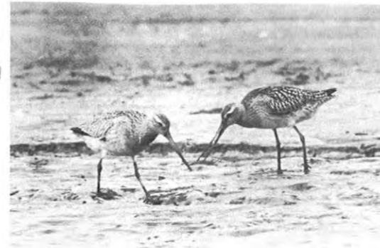
▲オオソリハシシキ