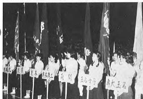
6.10—14,300人の若人が技と力を競う、第5回県高校総合体育大会は10日、4日間にわたる熱戦の幕を開けた。あいにくの雨で、開会式は熊本市体育館に変更されたが、若さと熱気で梅雨を吹き飛ばすようだった。