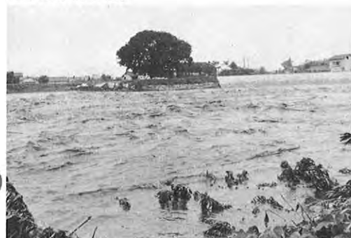
6.15—15日夜から16日未明にかけて県内は集中豪雨に見舞われ、総額40億5千万円にのぼる多大な被害を出した。県では15日から災害情報連絡本部を設置し、情報の収集、被災地の応急対策に努めた。