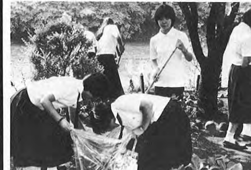
6.5—5日は「国際環境デー」。この日から一週間を「環境週間」として全国で色々な行事が行われた。県内各地でも、地域ぐるみの一斉清掃や花いっぱい運動などに汗を流す多くの姿がみられた。