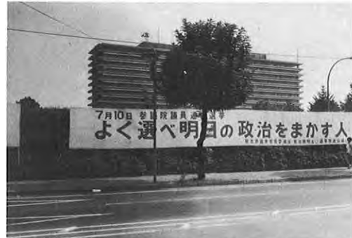
7.10—参院選熊本地方区は、1202カ所で投票が行われた。県下有権者総数は122万4千246人で、投票率は78.36パーセントだった。