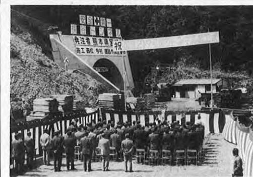
5.23—球磨郡湯前町と宮崎県児湯郡西米良村を結ぶ国道219号線「横谷トンネル」の起工式が行われた。総工費20億9千万円で56年度開通が見込まれている。開通により所要時間3時間が1時間近く短縮される。