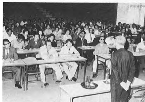
6.8—県民の声を県政に反映させることを主旨に、県政モニター(200人)の52年度全体会議が開かれた。約150人が出席し、副知事の県政について講演のあと、活発な質疑応答が行われた。