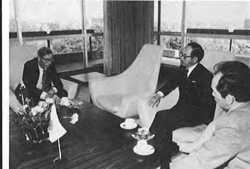
6.2—オーストラリアのJ・L・メナデュー駐日大使夫妻が、沢田県知事を表敬訪問した。同大使は、この3月に着任したばかり、貿易や文化など両国間の交流をさかんに呼びかけていた。