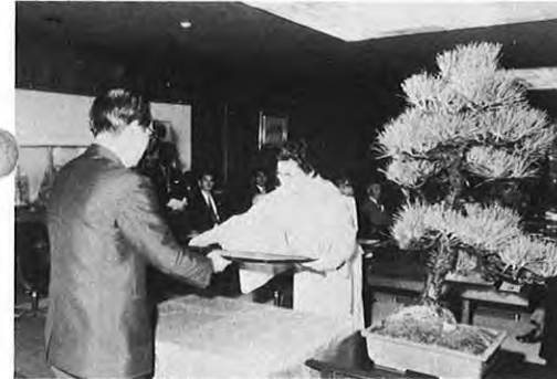
5.6 一春の叙勲の勲章等伝達式が県庁知事応接室で行われた。式には受章者15人が出席し、沢田知事から一人一人に勲章、勲記が手渡された。