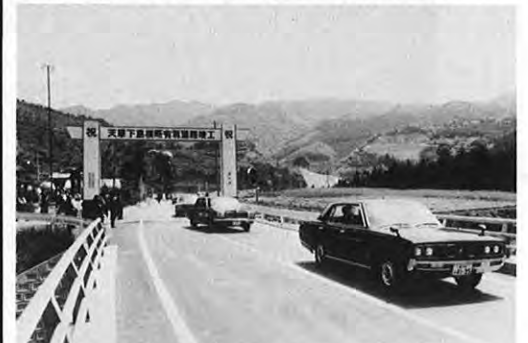
5.1 一本渡市伊宇土と天草町福連木を結ぶ県営天草下島横断有料道路が完成し、関係者約300人が出席して開通式が行われた。同有料道路は延長3,852m、うち860mがトンネル、162mが橋で、49年から23億円をかけて建設された。