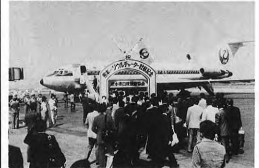
4.26 一日本航空の熊本空港-韓国ソウル間国際チャーター第1便が、沢田知事ら関係者116人を乗せ、熊本空港を飛び立った。これは熊本-韓国間の国際線開設の実績作りからも大きな期待がかけられている。