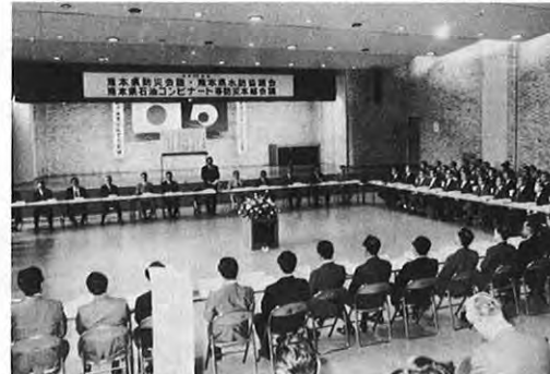
5.15 53年度の県防災会議が、関係者約130人が出席して、県庁地下会議室で開かれた。防災、水防計画などについて協議が行われ、9月には県では初めて地震を想定した総合防災訓練が実施されることになった。