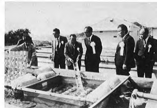
5.1 一牛深市下須島に完成した県栽培漁業センターの落成式が、同センター広場に約200人が出席して行われた。同センターはすでにマダイの種苗生産に取りかかっており、今後つくる漁業の本拠として期待されている。