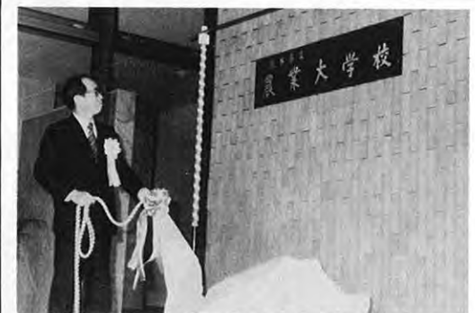
4.25 一県立農業大学の開学式、入学式が新装なった同校で行われた。15,600㎡の敷地に管理棟、教育棟、寄宿舎4棟があり、今年度中には実習施設、体育館、プールも完成する。全寮制で農学科、畜産学科があり新入生は134人(うち女子10人)。