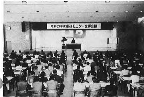
5.12 住民の声を行政に反映させる53年度の県政モニター全体会議が県庁で開かれた。今回モニターとしてお願いしたのは主婦30人を含む200人。モニターは「県政の御意見番」として自由通信や課題通信のほかモニター会議で意見交換する。