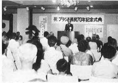
7.22—ブラジル移民70周年記念式典が、沢田県知事や海外移住者の留守家族など250人が出席して、熊本市のデパートで開かれた。また「大ブラジル展」も開催された。