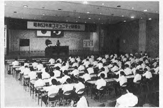
7.10—これからのコミュニティづくりはいかにあるべきかと、県、市町村のコミュニティ担当者約160人が参加して、県庁地下会議室で研修会が開催された。