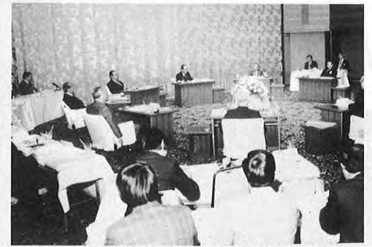
6.2—第71回九州地方知事会議が熊本市のホテルに山口、沖縄を含む九州各県知事らが出席して開かれた。九州新幹線など整備五線の年度内同事業の働きかけなどの方針を決めた。