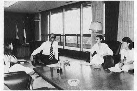
6.26—日本留学を通じて本県の事情を理解させ、交流と親善を深める本県出身海外移住者の子弟留学生5人が沢田知事を訪問した。