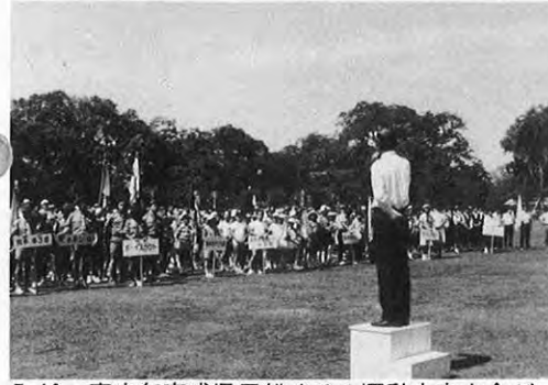
7.16—青少年育成県民総ぐるみ運動中央大会が、熊本城二の丸広場で開かれた。大会にはボーイスカウトやガールスカウト、青年・婦人団体など約1,000人が参加した。