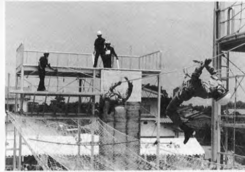
7.11—消防職員の日ごろの訓練成果を競い合う県消防救助技術大会が、玉名市の有明消防本部で開かれた。大会には県下14の消防本部などから390人が参加した。