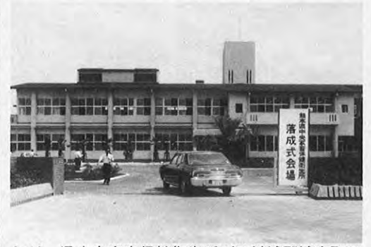
6.12—県中央家畜保健衛生所が下益城郡城南町の舞原台地に完成した。施設拡充のため新築移転したもので、総工費は2億9,000万円。