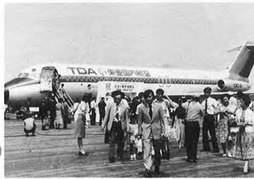
7.20—熊本—東京羽田空港間に新たに東亜国内航空の定期便が就航した。これで既設の全日空とともにダブルトラッキングが実現し、熊本空港は新時代の幕を開けた。