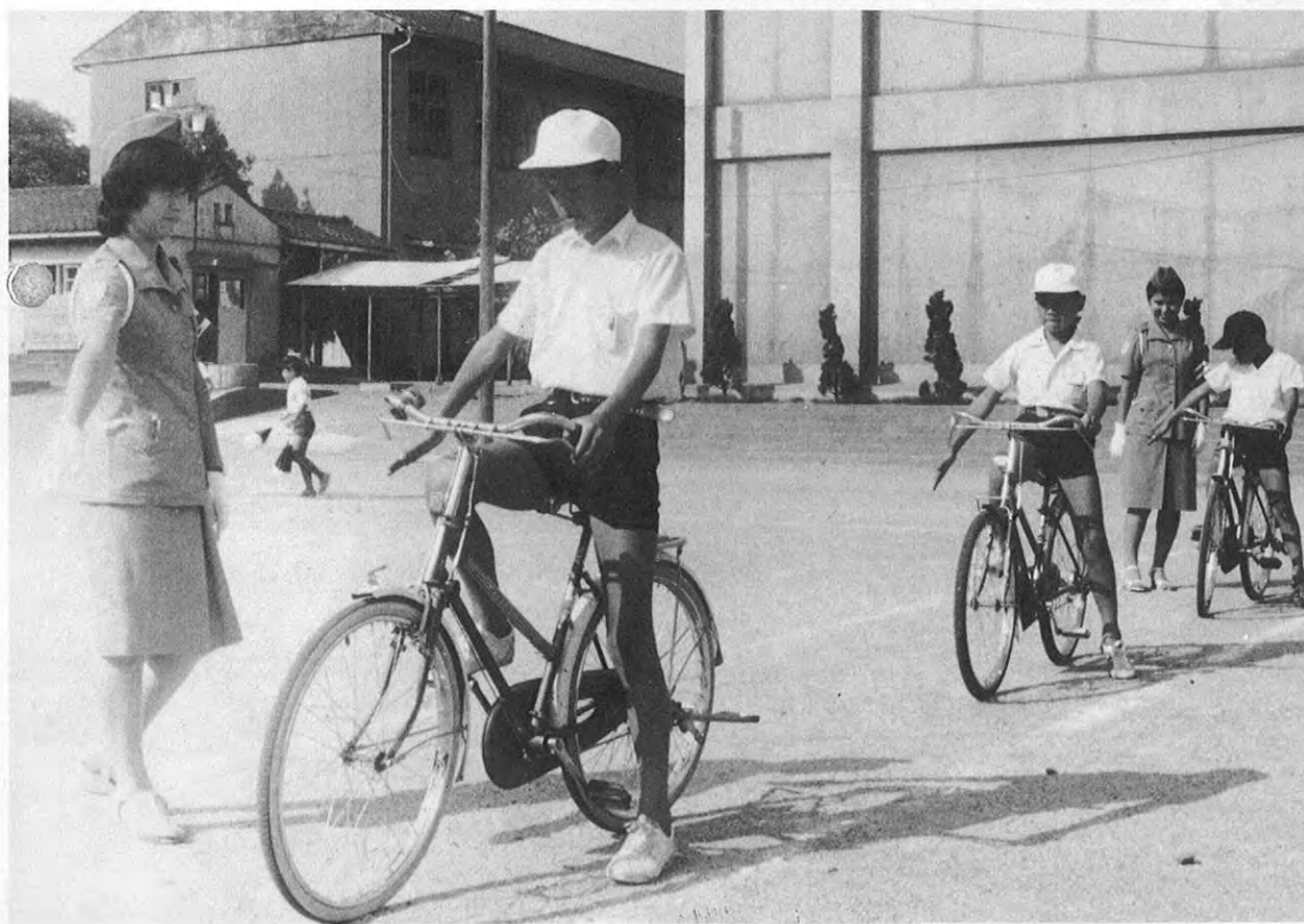
⑥正しい自転車の乗り方を指導する交通巡視員