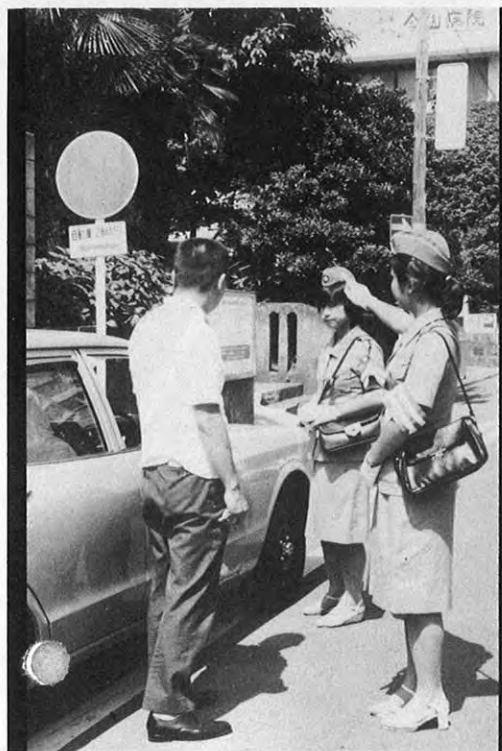
④駐停車違反の取締りをする交通巡視員

表紙は織込花筵(農業試験場八代支場) 本県のい業は恵まれた自然条件のなで日本一のイ草生産量をほこっています。