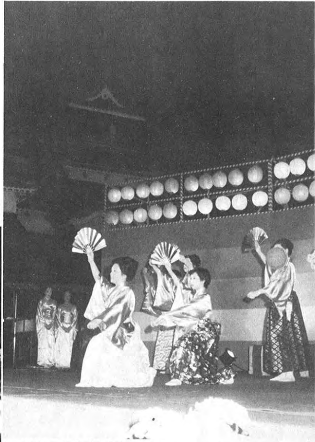
▲熊本城を背景に「邦楽の夕べ」