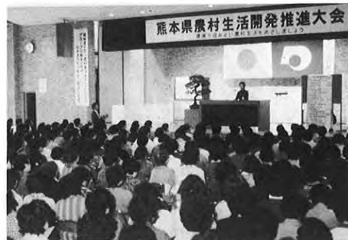
2.23 — 第14回県農村生活開発推進大会が県庁で開かれた。大会には農家の主婦ら800人が出席し、生活改善優秀グループの表彰があり、実績発表も行われた。