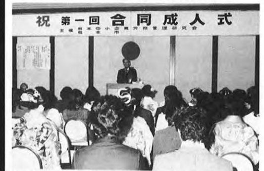
1.21 — 中小企業勤労者の第一回合同成人式が熊本市のホテルで開かれた。式には新成人ら関係者約100人が参加し、藤本副知事が祝辞を述べた後、懇親会が行われた。