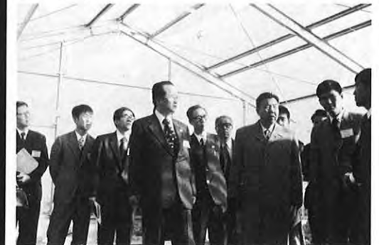
1.22 — 県内の近代的な農村地帯を訪問し、友好・交流を深めることを目的にやってきた北京放送局訪日代表団の一行11人が、飽託郡飽田町の長ナス産地を視察した。