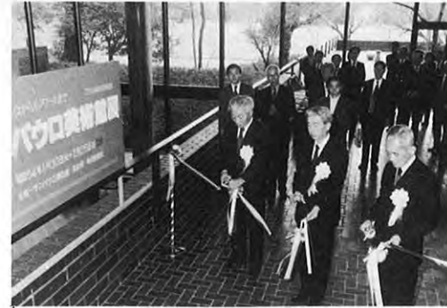
1.30 — イタリア・ルネサンスから近代までヨーロッパ絵画史を彩る名画を集めたサンパウロ美術館展が県立美術館で開かれた。名画50点にフアン列が続いた。