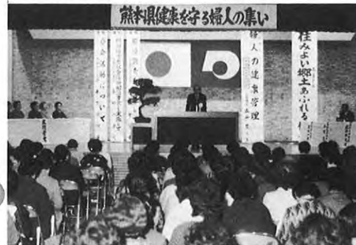
2.20 — 「熊本県健康を守る婦人のつどい」が、県庁で行われた。県下各地から約800人が出席し、特別講演や各支部の研究発表が行われた。