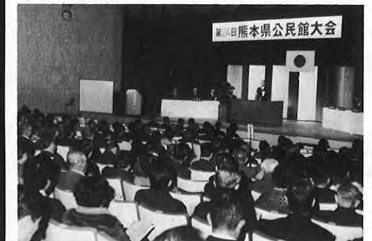
1.26 — 第24回熊本県公民館大会が熊本市の郵便貯金会館に約600人が出席して開かれた。職員表彰の後、意見発表、映画観賞、講演が行われた。