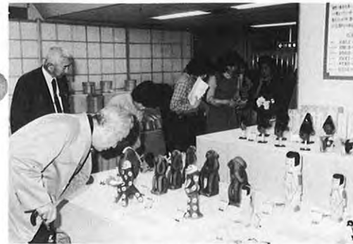
1.31 — 「ふるさとの伝統の技を求めて」をテーマに第三回県伝統工芸品展が熊本市のデパートで開かれた。肥後象嵌や刃物、山鹿灯ろうなど約500点が展示、即売された。