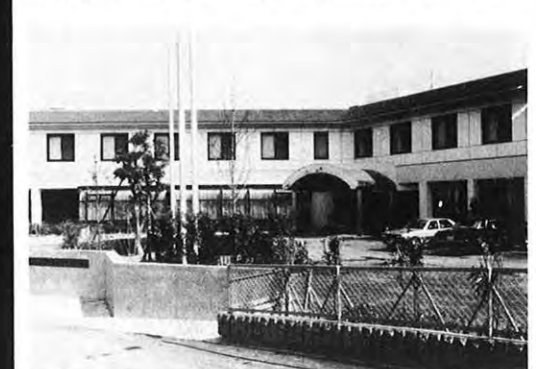
4.11 — 芦北郡芦北町と田浦町にまたがる県立芦北海岸公園国民保養地内に国民年金保養センター「あしきた」が完成した。同センターは芦北地方の観光の拠点として地元の期待は大きい。