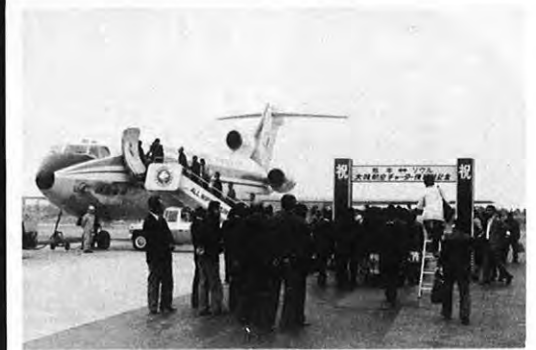
3.19 — 大韓航空のチャーター機が、熊本空港に初めて乗り入れた。外国の旅客機が、同空港に飛来したのはこれが初めてで、国際空港への大きな足掛かりになると期待されている。