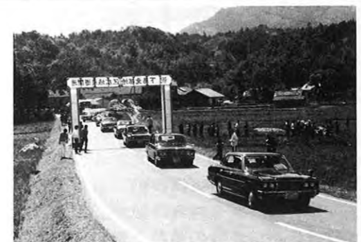
4.12 — 天草下島の本渡市と苓北町を結ぶ広域農道が開通した。全長13.1km、総工費約21億円。この開通で水田、畑、樹園地約1,340haが受益、車の所要時間も半分に短縮される。