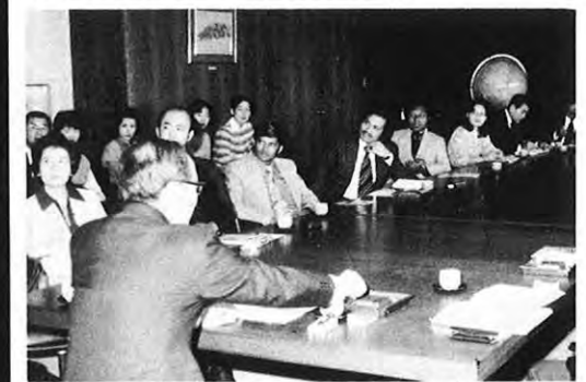
3.28 — アジア、オセアニアの青少年担当職員10人が県庁を訪れ、沢田知事と懇談した。これは総理府の青少年国際交流事業の一環として総理府が招待したもの。