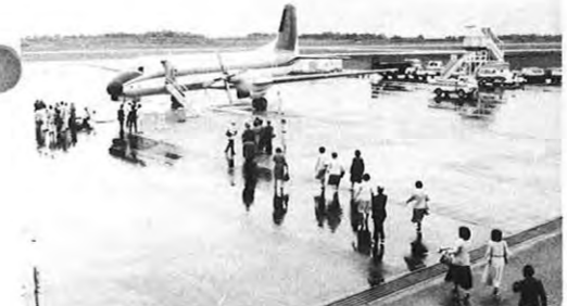
5.1 — 東亜国内航空 (TDA) の熊本—高松線が開通され、空港で記念式典が行われた。熊本—高松線は1日1往復、所要時間は1時間20分、運賃は大人片道12,200円 (子供は半額)