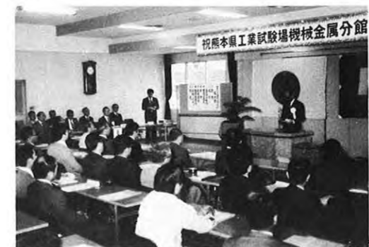
5.7 — 県工業試験場 (熊本市東町) の機械金属分館が完成し、関係者100人が出席して落成式が行われた。分館は公害防止研究が主となるが、材料試験室、金属分析試験室等を備えている。