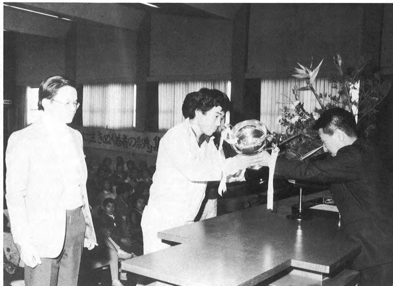
▶総合優勝の上益城青年農業者クラブへ坂本県農政部長からカップの贈呈