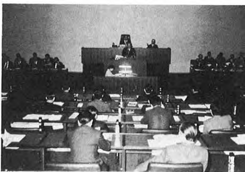
12.7一12月定例県議会は7日から会期16日間で開かれ、総額7億7,112万円の補正予算案件など予算関係13件、条例関係10件、議決案件14件、その他1件の計38件を議決しました。