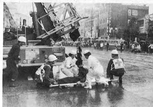
10.14一県、県警、消防局、日赤、自衛隊が一体となった県下初の総合防災訓練が、デパートから出火、内には3000人の買い物客がいるという想定で行われました。