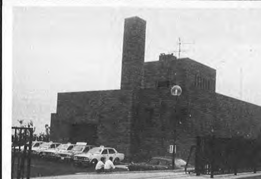
9.12一天草郡茶北町と中国・上海を結ぶ日中海底ケーブル茶北中継所の開所式が現地で行われました。国際通信480回線の容量を有し日中間の通話のほか、他の国々との通信にも利用される。