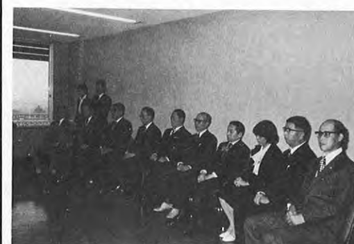
10.9一地域のスポーツ活動のリーダーとして県のスポーツ振興に努めた「スポーツ功労者」の表彰式が行われ、10人が表彰されました。