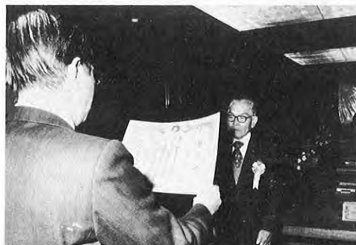
11.27一伝統継承をたたえる第2回ふるさと顕彰の顕彰式が行われ、伝統工芸4人、民俗芸能10団体、2個人に顕彰状が手渡されました。