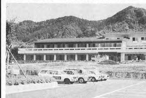
10.1一阿蘇郡高森町に建設中であった南阿蘇国民休暇村がオープンした。221人収容の鉄筋コンクリート3階建てで、根子岳・高岳が望め、四季折りの阿蘇の自然が楽しめる。