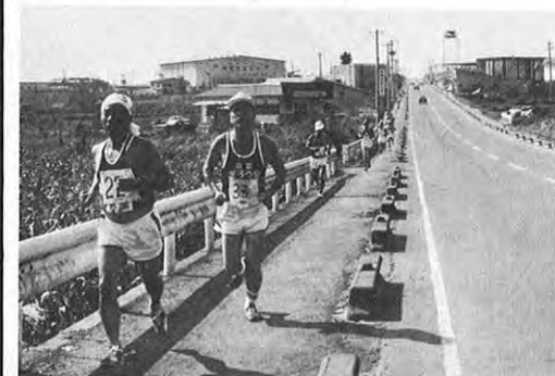
10.2一第18回体力づくり運動推進全国大会が行われた。シンポジウムのほか、歩け歩けやオリエンテーリングなど12種目に2500人が元気に参加した。