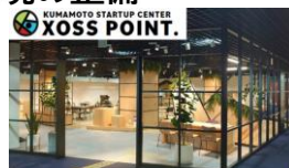
スタートアップ支援施設「XOSS POINT.」