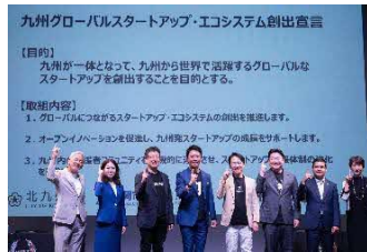
九州5市長による『九州グローバルスタートアップ・エコシステム創出宣言』を发出

九州が一体となって、九州から世界で活躍するグローバルなスタートアップを支援する『九州グローバルスタートアップ・エコシステム創出宣言』を发出 ※熊本市長、福岡市長、北九州市長、別府市長、鹿児島市長による共同宣言