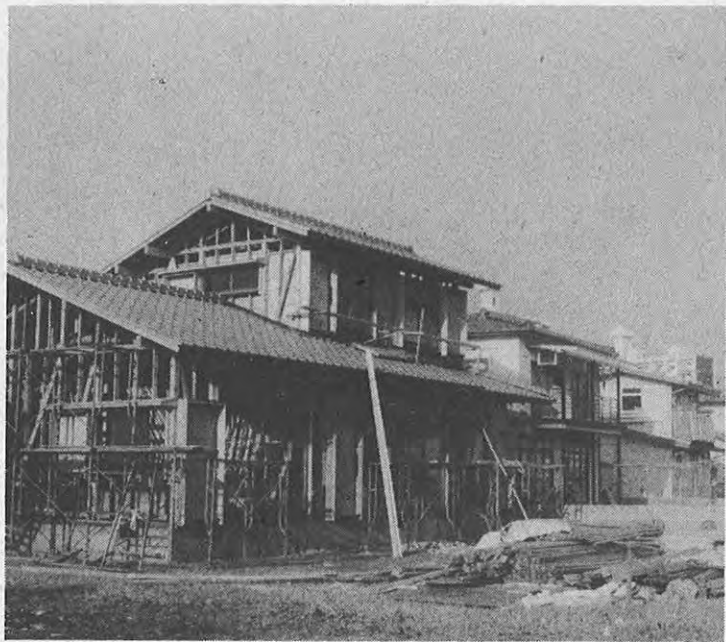
▲熊本市近郊に建設中のマイホーム