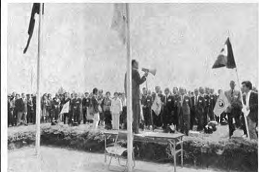
10. 24—日本と中国の相互理解を深める「熊本県日中友好の翼訪中団」の一行136人(行政・経済農林・水産・文化・婦人・労働・医師・各団体の代表)が中国を訪問しました。