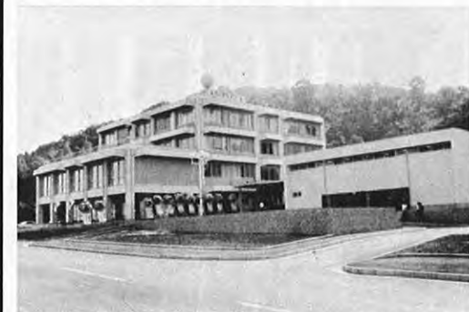
10. 1—熊本市石原町の神園山ろくに9. 1完成営業を始めていた勤労者福祉センター「火の国ハイツ」の落成式が行われました。宿泊施設・結婚式場・多目的ホールを備えたものです。