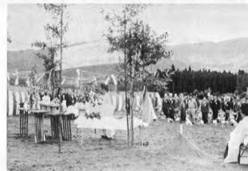
10. 28—南阿蘇広域農業開発事業が高森町で着工されました。同事業は5カ年継続事業で肉用牛飼育のための共同利用牧場をつくり、畜産農家の経営安定をめざすものです。総事業費47.7億円。