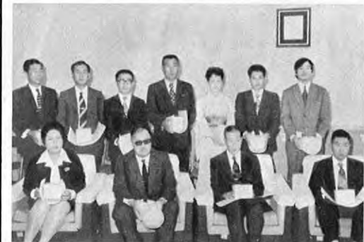
10. 11—地域スポーツ活動のリーダーとして県スポーツ振興に努めたスポーツ功労者11人の表彰が県教育委員会室で行われました。