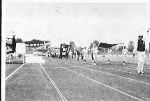
9. 27—第30回県民体育祭は21郡市から役員選手5,637人が参加、熊本市を中心に43会場で2日間にわたり行われました。