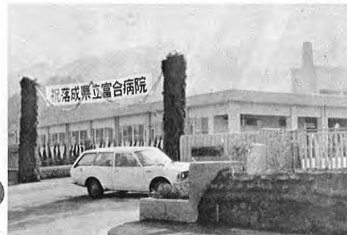
11. 1—下益城郡富合町に建設していた県立富合病院がオープンしました。一般精神科・精神科と結核の合併症・小児病と脳器質障害などの患者が対象となります。病床250 総工費13.8億円。