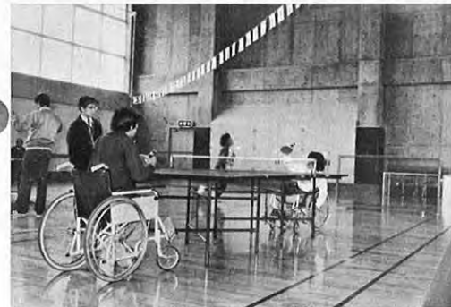
10. 31—身体障害者の皆さんの福祉増進のため、熊本県身体障害者体育館がオープンしました。バスケットコート一面、バレーコート二面、バトミントンコート三面および鉄棒、卓球等の設備があります。