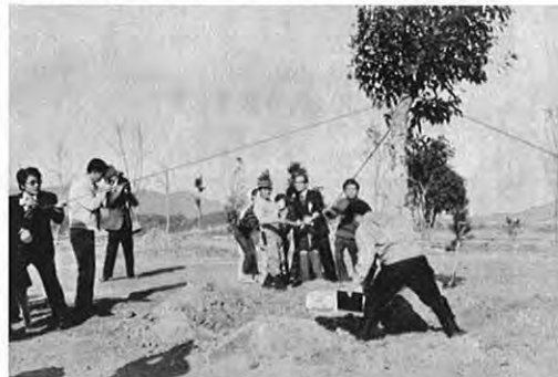
12. 1—松橋療護園の創立20周年を記念して、退園児寄贈の樹木による植樹祭が行われ「小鳩の森」と命名されました。