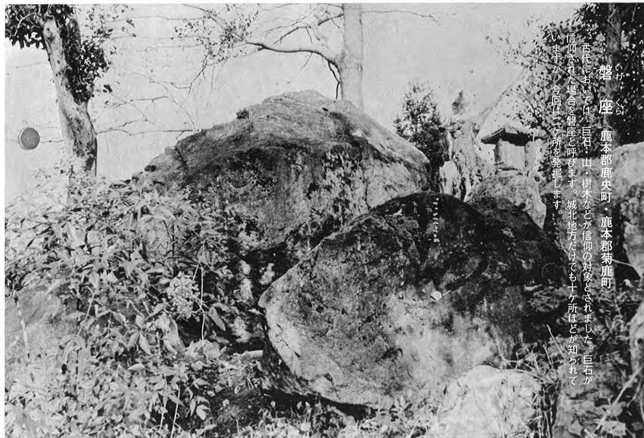
▲鹿本郡菊鹿町の磐座

磐座 (いわたくら) (鹿本郡鹿央町・鹿本郡菊鹿町) 古代においては、巨石・山・樹木などが信仰の対象とされました。巨石が信仰された場合を磐座と呼びます。城北地方だけでも十ヶ所ほどが知られていますが、今回は二ヶ所を挙げてみます。