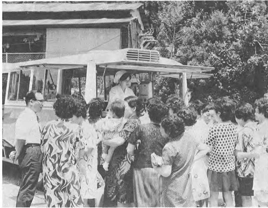
▲栄養改善は住民の健康維持増進の基本です

★へき地医療連携対策……… …百二十万円 無医地区における住民の健康増進を図るため、健康診断など健康管理を実施します。