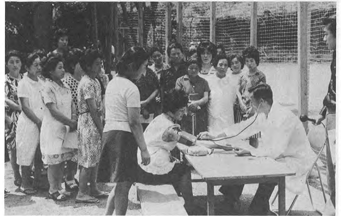
▲へき地住民の健康を守る「巡回診療」

本県人口は、昭和三十年以来、長い間減少傾向にありましたが、五十年の国勢調査概数では、全県の人口は百七十一万五千人となり、四十五年時点と比較して〇・八%微増を示しました。