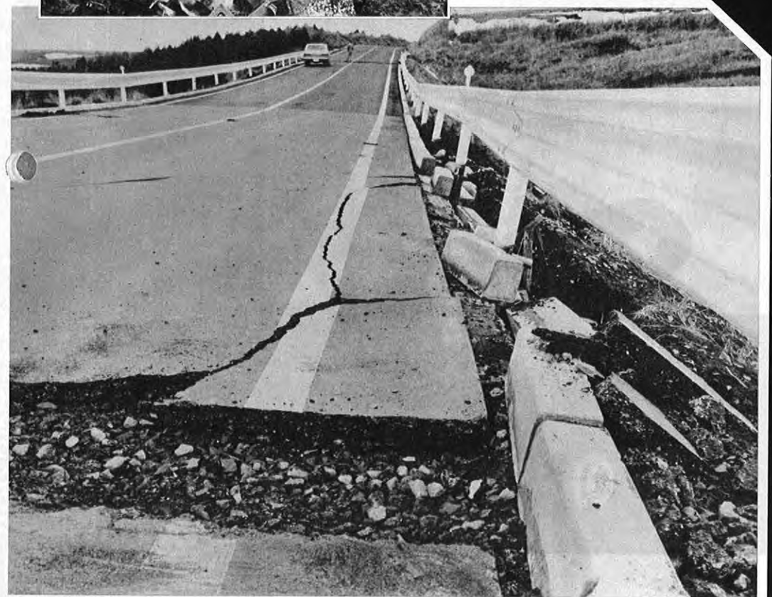
▲九州横断道路の地割れ