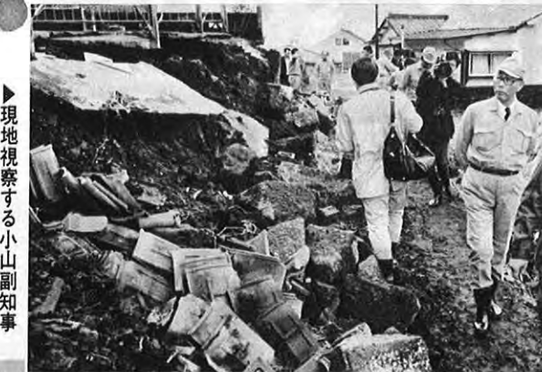
▶ 現地視察する小山副知事 (知事職務代理者)