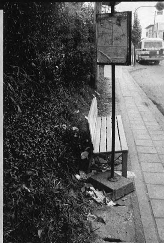
▲バス停のゴミ、きたないですね！