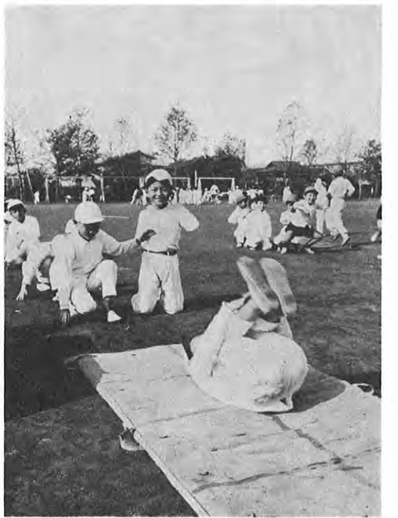
▲すくすく育て子供たち（熊本市で）