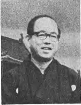
▲農協組織の強化を

しかし、いずれの対策を進めるにいたしましても農民の民主的な自主的な組織であります農協の組織の強化ということ