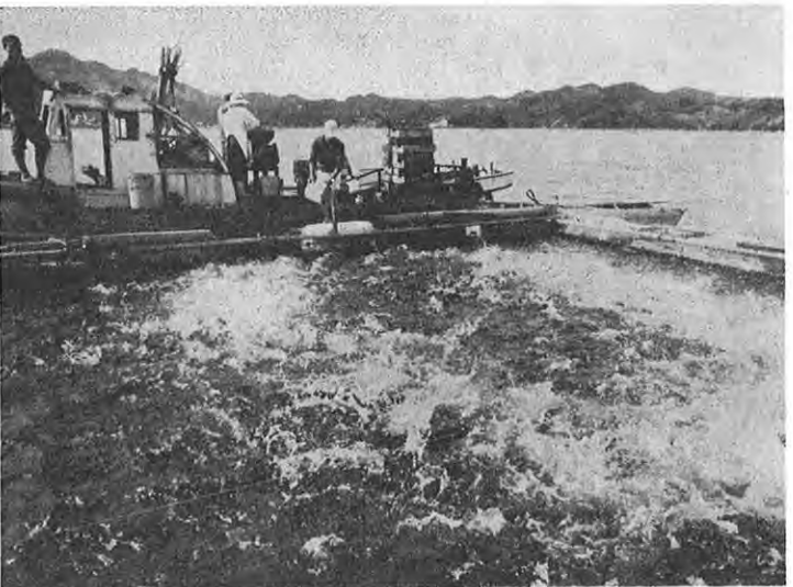
▲つくる漁業の振興へ（牛深市で）