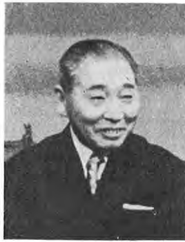
▲農業の団地化を進めて

杉本 農業の位置づけというものが基本的に一番大事だと思っております。位置づけと申しましても農業の人口は相当ありましてどちらかというと所得がたりないから出稼ぎをするというところに問題があるわけです。ですから何とかして出稼ぎをする人が県内で仕事に就ける方法をま