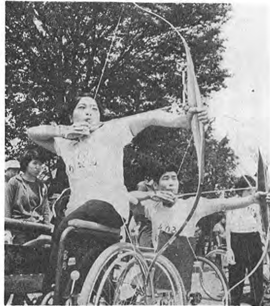
スポーツにいそしむ身障者（スポーツ大会）