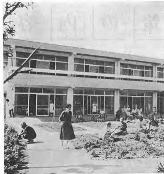
花づくりを楽しむご老人たち

を整備します。これも四十八年から始めるもので重度更生施設（五十人収容）一ヶ所、身障療護施設を二ヶ所建設します。 ★ 重度障害者生活環境改善費助成……百五十万円 浴そう、湯沸器の取付費用を一件十万円以内で助成する制度です。 ★ 身障者用トイレの設置……七十万円 身障者の外出時におけるトイレ問題を解決するため、県庁と福祉会館につくります。 ★ 身障者結婚相談補助……五十五万円 結婚相談事業の運営費に補助します。 ★ 点字広報紙の発行……十六万円 盲人に県政の実態を知ってもらうため、年四回、五百部を発行します。 ★ 自動車運転免許取得委託……八十七万円 ★ 身障者体育大会……百十三万円 五月に県大会、十月に全国大会を行ないます。 ★ 重度身障者介護員派遣……三十五万円 一時的に介護を要する者の日常生活を促進するため、介護員を派遣します。 ★ 施設入所者更生援護費……一億三千四百五十二万円 訓練と職業指導を行なう施設委託費と更生訓練費です。 ★ 身障者向公営住宅建設……二千六百二十九万円 重度障害者向けに十二戸を改造します。