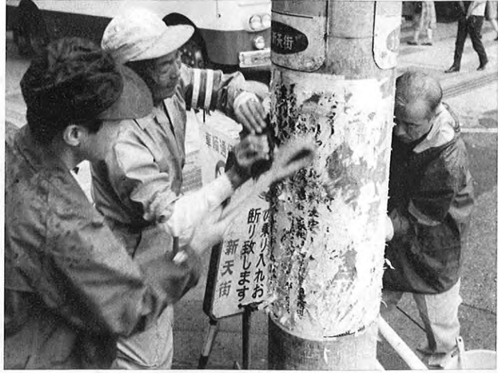
▼各土木事務所では違法な屋外広告物を撤去