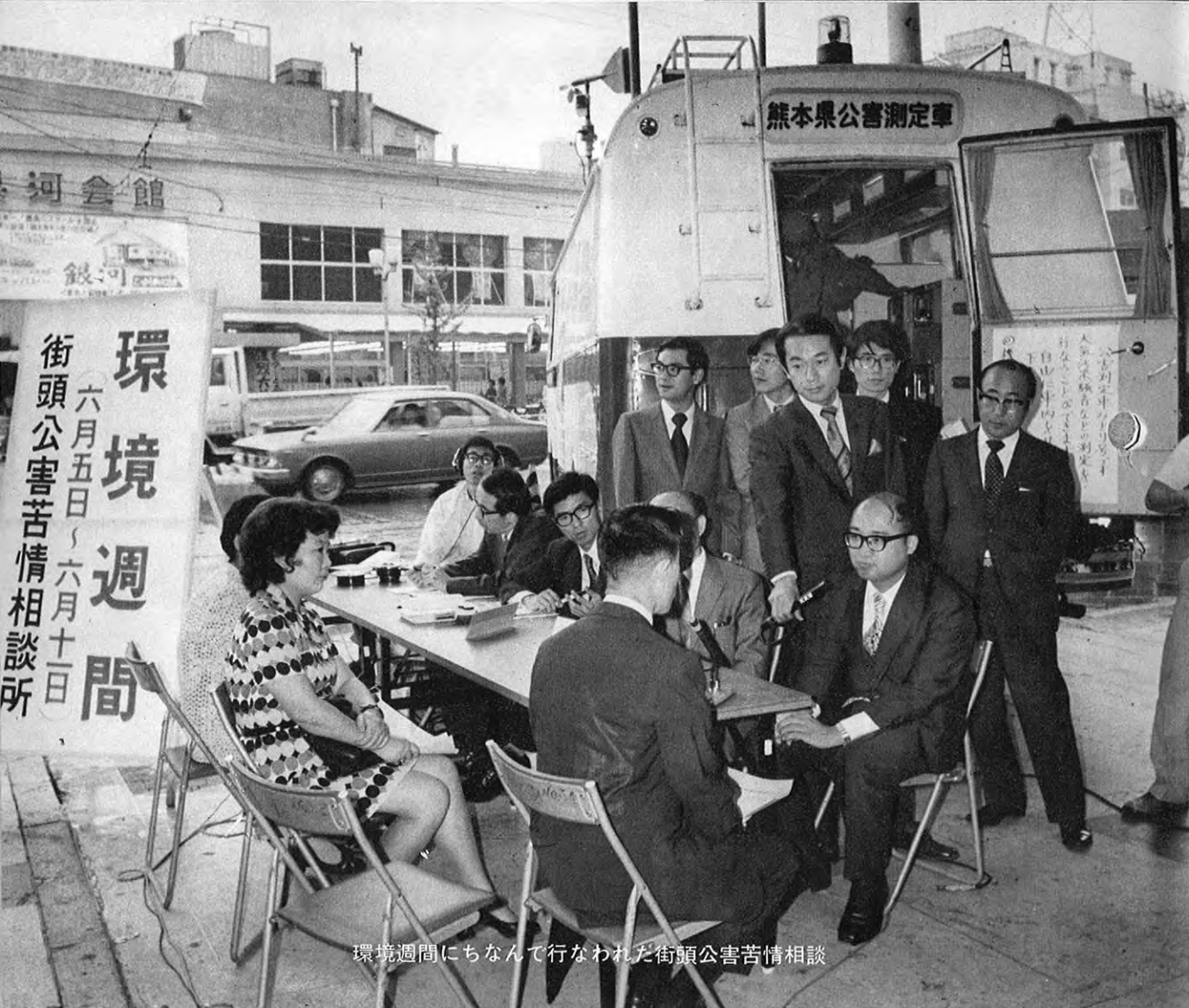
環境週間にちなんで行なわれた街頭公害苦情相談

私たちの郷土、熊本は、阿蘇・天草をはじめすばらしい自然環境に恵まれています。しかし、それも乱開発や公德心の欠如によって、一部ではかなりの破壊が進み、観光地や各地の川や海は、ゴミ・工場公害・家庭排水などできたなく汚れ、このまま放っておけば取り返しのつかないことになりかねません。そこで県では、熊本の美しい自然を守り、住みよい生活環境をつくっていくために、昨年からは皆さんと一緒になって、自然の保護、郷土の緑化、清掃浄化を柱とする、美しい熊本づくり運動を進めています。副次的にはこの運動を県民総参加の県政への足がかりにしたいとも考えています。 忙がしくて運動に積極的に参加できないという人でも、ゴミをむやみに捨てない、ゴミを持ち帰る、街路樹や花をかわいがり、自然をこわさないという心がけだけでもいいのです。誰のためでもない、私たち自身のために力を合わせて住みよい生活環境をつくっていきましょう。