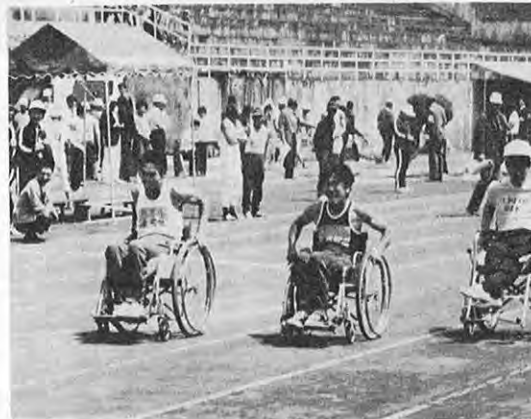
▲ 身体障害者体育大会

最近、県内の身体障害者（児）は、激増する交通事故をはじめ、種々な原因により、増加傾向にある。他の福祉施設にくらべ立ち遅れを見せている身障者福祉施設を総合的に建設して、社会変動の中で身障者が取り残されることがないようにその体系的推進を図ります。