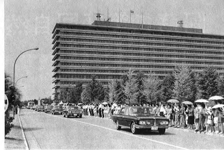
▲県庁をご出発になる皇太子殿下、同妃殿下