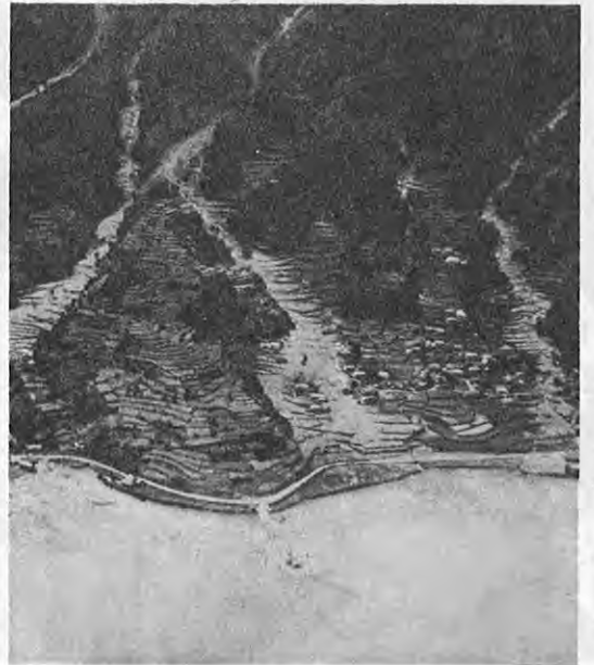
不意に襲った土砂災害(上天草被災地)

総需要抑制による公共事業費の削減をうけて、県全体の国土保全にも予算面での影響をうけること大です。しかし、四十八年十一月の大津波・大津波火災の河川・砂防・治山・海岸保全・道路整備 教訓を生かして、防災面でもその体制整備