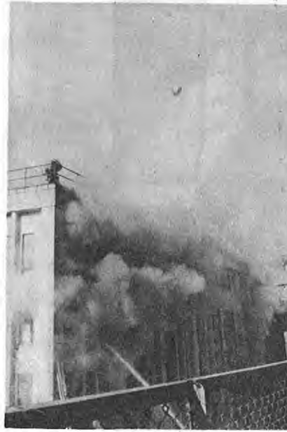
繰り返すまじこの惨事ノ

備を図ります。四十七年六月七月の集中豪雨による天草上島地区の被災地対策は昨年引継ぎ諸施策を推進します。