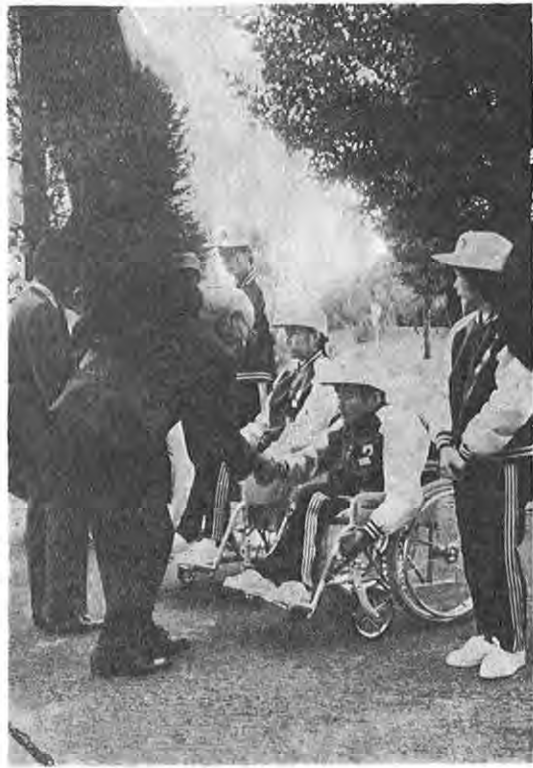
全国身体障害者体育大会出場者結団式

激しく変動する経済社会に対応するこ とのむつかしい身体障害者への福祉対策 は障害者が自立更生し明るく希望のある 生活がなされるよう、在宅の障害者に対 する施策と施設を必要とする障害者対策 を体系的に分けて推進しています。 四十九年度は身体障害者福祉センター の建設、身体障害者向け公営住宅建設を 初めとして次の事業を重点的に実施しま す。 ☆身体障害者福祉センター等の建設…… 三億二千五百六十一万円 福祉センターには宿泊施設、訓練室、 点字図書館等を設け障害者の社会適応訓 練やレクリエーション及びボランティア ★進行性筋萎縮症者療養等給付…… 重度の身体障害者の日常生活を容易に するため浴そう、便器等の生活用品を給 付します。 三百五十万円 ★重度障害者日常生活用具給付…… 日常生活を営むうえで支障のある身体 障害者に対し無料で日常生活の世話をし ます。 七百四十八万円 ★身体障害者家庭奉仕員の派遣…… 日常生活を営むうえで支障のある身体 障害者に対し無料で日常生活の世話をし ます。 三百五十万円