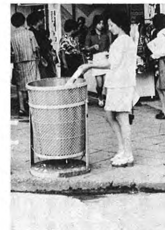
▲このように活用して下さい