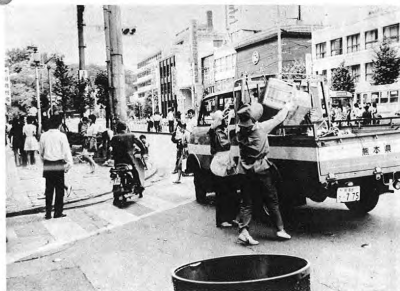
▲街頭のチリ箱は歩行者用、ラーメンの汁など入れないで

美しく住みよい郷土をつくるために、美しい熊本づくり運動をはじめて一年半。熊本駅、市民会館、水道町、大甲橋、体育館、健軍間12キロメートルに道路花壇作りを計画してこれをシンボルゾーンと名付けています。昨年度は市民会館から水道町までの道路花壇、街路樹、チリかご、灰皿などを整備しました。この区間は熊本市内のメイン道路、1昨年と比べると見ちがえるほど美しくなったとおほめの言葉もちらほら。清掃にたずさわる人たちの悩みの種は、歩行者用のチリかごに、不燃物や商店街からのダンボール、はたまたラーメンの汁などが入っていること。今年は大甲橋、体育館を整備する予定です。上手にご利用いただくことをお願いします。