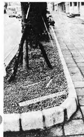
▲ふまないどころか倒されました