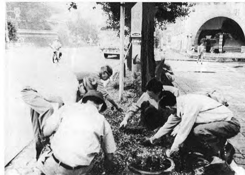
▲早朝、街の有志も出での草取りです