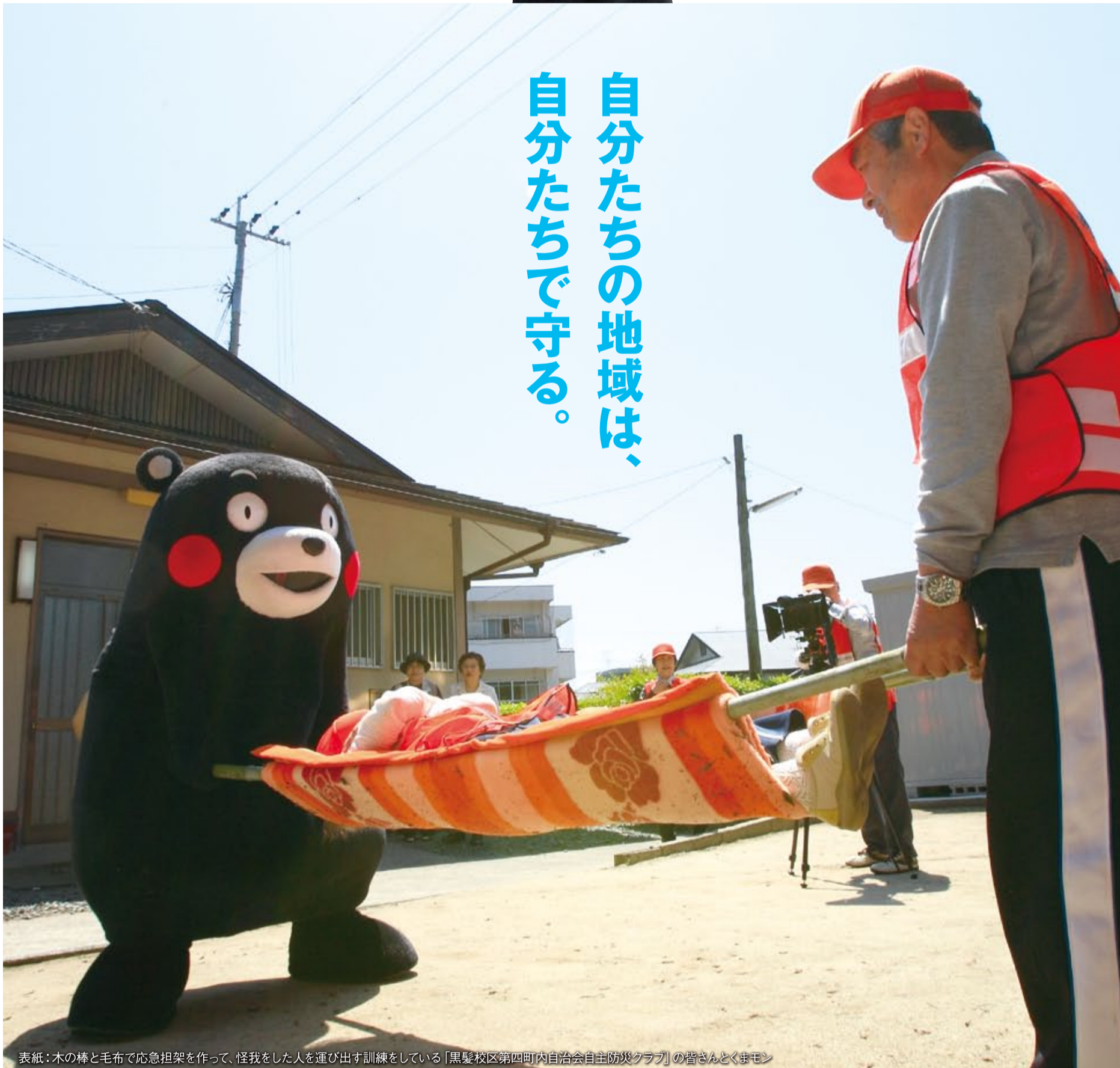
表紙：木の棒と毛布で応急担架を作って、怪我をした人を運び出す訓練をしている「黒髪校区第四町内自治会自主防災クラブ」の皆さんとくまモン