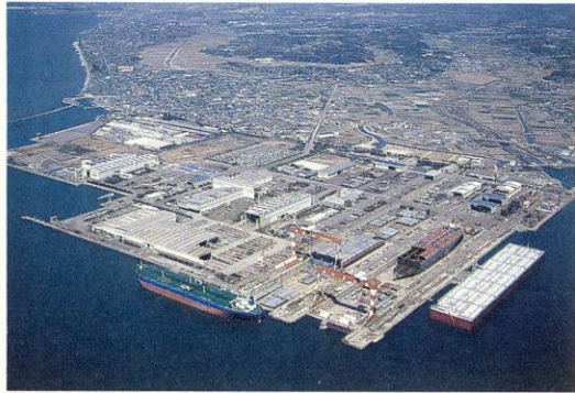
日立造船(株)有明工場

当地域では、施設野菜の生産が順調に拡大し、平成六年度は野菜の農協共販額が月に百億円を突破しました。いちごの生産高が県下の五割、春トマトは七割を占めるなど主産地を形成していますが、