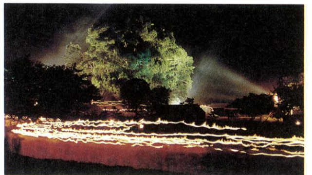
菊水町古墳祭松明行列

また、東屋形地区では、土地区画整理事業や公園整備などにより、快適な住環境が形成されます。