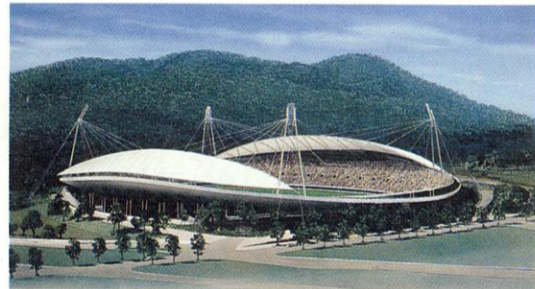
熊本県民総合運動公園陸上競技場(仮称)完成予想図

◎秋季主会場本工事着工 「くまもと未来国体」の秋季大会で開閉会式の会場となる、県民総合運動公園陸上競技場の本工事の起工式が十月二十六日に行われました。競技場の概要は左の通りです。