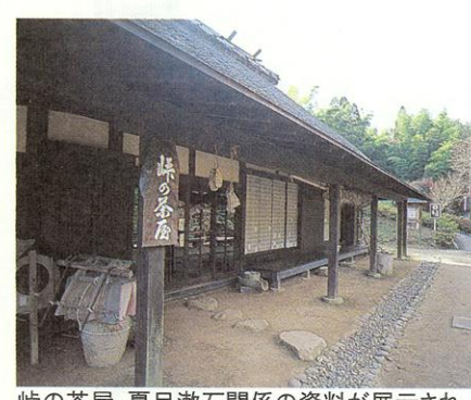
峠の茶屋。夏目漱石関係の資料が展示されている。(熊本市)