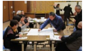
平成23年度に開催したワークショップの様子

県では、このようなデータを細かく分析して、「夢」や「誇り」に関する満足度を高めていくために「しあわせ部」を設立するなど、新しい取り組みにつなげています。また、今後、地域ごとの幸福の姿を見出していくためのワークショップを開催していきます。