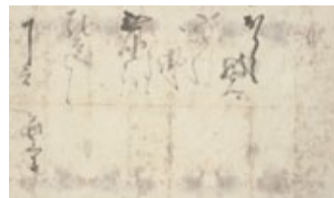
〈信長自筆感状〉永青文庫所蔵／後期展示

昨年6月に重要文化財に指定された細川家文書の中から、信長文書59通を一挙公開。乱世を駆け抜けた信長の真実に迫ります。