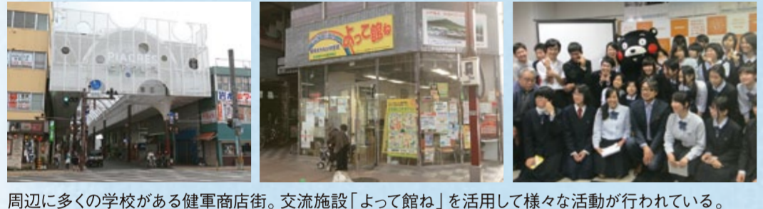
周辺に多くの学校がある健康商店街。交流施設「よって館ね」を活用して様々な活動が行われている。

向かい合って「ほめ言葉」を返し合う子どもたち。周囲の子どもたちもその言葉に聞き入っている。