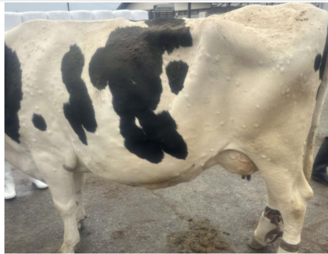
ランピースキン病発症牛

2024年11月に県内1例目の発生が確認されて以降、現在までに、県内では3例の発生が確認されています。本病は、死亡率は高くありませんが、全身の皮膚の結節や水腫、発熱、泌乳量の減少などの症状を呈し、まん延防止のため、隔離や移動自粛、ワクチン接種等の対応があります。牛飼養農家の皆様におかれましては、健康観察の徹底、サシバエ等の害虫駆除及び農場内の清掃・消毒等、引き続き防疫対策の徹底をお願いいたします。