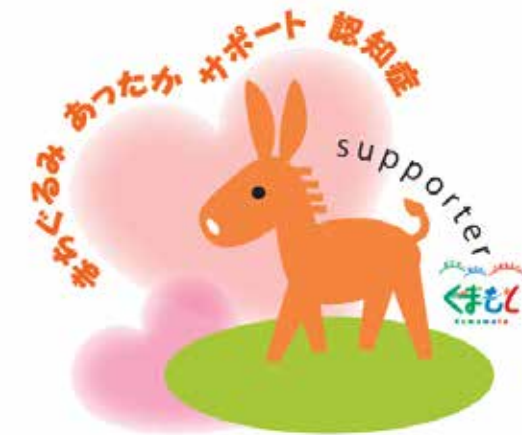
熊本県認知症啓発シンボルマーク