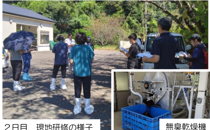
2日目 現地研修の様子