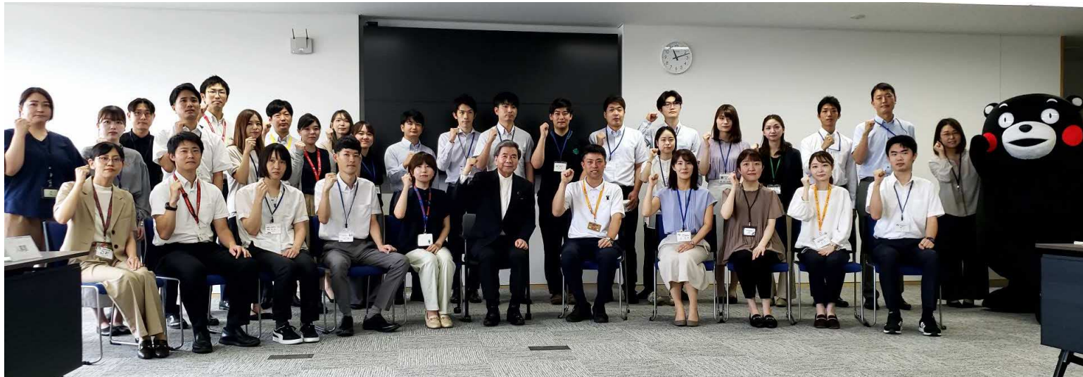
令和5年度 第1回「こどもまんなか熊本」プロジェクトチーム会議において撮影した 蒲島元知事と応援団の集合写真（2023年6月7日撮影）

結婚・子育て経験の有無等に関わらず、 結婚や子育て、庁内の働き方について率直な意見を述べる。