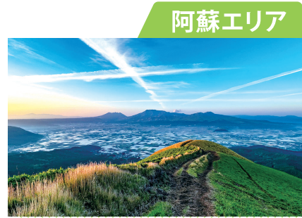
すべての観光要素を網羅し五感を刺激する

西は有明海に面し、東はなだらかな山々が連なる県北エリア。自然の壮大さを感じられるスポットがアクセスしやすい場所にあり、観光資源の一つとなっています。温泉地も点在し、リフレッシュに多くの人が訪れています。