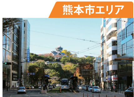
熊本城を中心に歴史と最先端が融合する

熊本市に隣接する宇城・上益城地域からなる県中央エリア。世界遺産である三角西港や日本最大級の石造アーチ橋の通洞橋など、歴史的建造物が点在します。また、阿蘇くまもと空港をはじめとした交通の拠点としても発展しています。