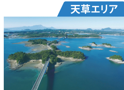
異国情緒に包まれたリゾート地

鹿児島県との県境にあり、八代海に面した八代地域・芦北地域、球磨川流域に広がる球磨地域で構成されています。日本三大急流の一つである球磨川は、川下りやラフティングなどを楽しめるスポットとしても人気です。