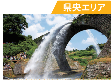
日本が誇る歴史的建造物が多く点在する

阿蘇エリアは熊本県の東部、大分県・宮崎県との県境近くに位置しています。阿蘇エリアのシンボルは何と言っても、世界最大級の大きさを誇るカルデラを有する活火山・阿蘇山。圧倒的なスケールの景観は必見です。