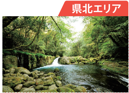
歴史・伝統に触れるスポットがたくさん

西は有明海に面し、東はなだらかな山々が連なる県北エリア。自然の壮大さを感じられるスポットがアクセスしやすい場所にあり、観光資源の一つとなっています。温泉地も点在し、リフレッシュに多くの人が訪れています。