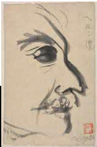
・「ヘルン像」小泉清 1950 年 墨・紙 小泉八雲記念館所蔵

記念事業の一環として、ハーンから学ぶ「現在（いま）に生きるハーン」と題して、八雲が発信した文化資源を再認識するとともに次世代を担う青少年がハーンの世界について学ぶ機会として、小泉八雲の名作『怪談』を漫画で描く作品を募集します。