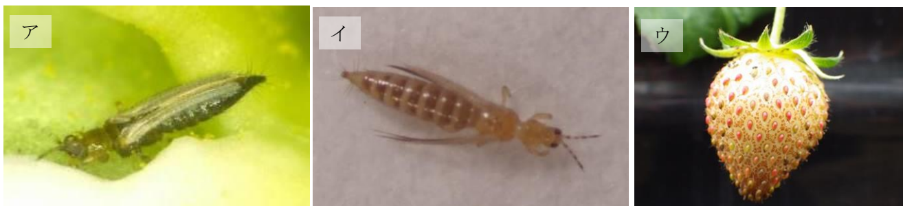
図3 ア：ヒラズハナアザミウマ成虫、イ：ミカンキイロアザミウマ成虫、 ウ：アザミウマ類によるイチゴの果実被害

熊本県病虫害防除所 (熊本県農業研究センター 生産環境研究所内) 担当：福岡、江口 TEL：096-248-6490