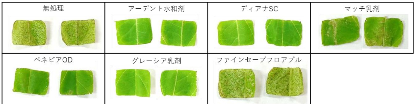
図2 72時間後におけるインゲン葉片の被害程度