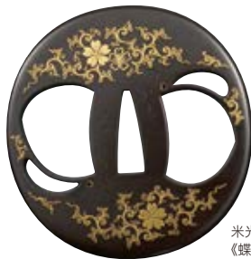
米光太平 《蝶影鏤空唐草圓劍格》 本館收藏