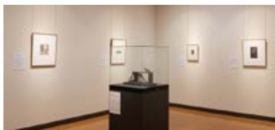
濱田知明 《初年兵哀歌(步哨)》 本館收藏