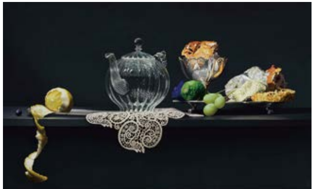
五味文彦《玻璃茶壺靜物畫》