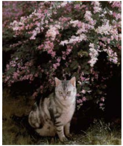
藤原秀一《胡枝子與貓》