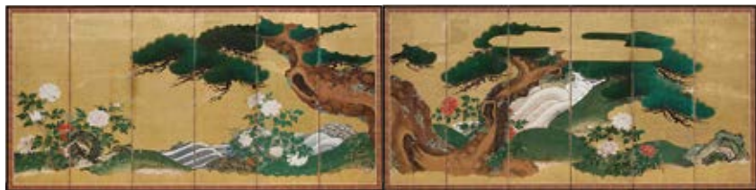
《老松牡丹圖》永青文庫收藏 寄存本館