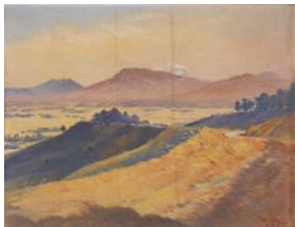
青木彝藏《阿蘇風景》本館收藏

展示本館多姿多彩的館藏，包括細川家家傳的盔甲與大名道具、與熊本頗具淵源的書畫與工藝，乃至於近代到戰後的美術。此外，也將介紹2023年度收集的新收藏品。