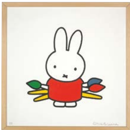
《miffy 45th》 Dick Bruna Japan Inc.

本展將由米飛兔陪您鑑賞熊本縣立美術館的館藏，讓親子一同接觸美術。同時也將展出創造米飛兔的繪本作家暨平面設計師——迪布納的海報及封面設計，一探其作品的祕密。