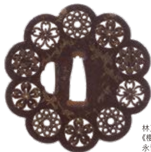
林又七 《櫻九曜文透鐙》 永青文庫收藏