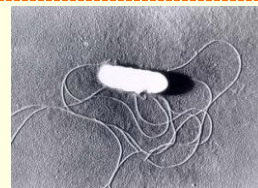
リステリアの顕微鏡写真（約0.5×1μm）

リステリア（リステリア・モノサイトゲネス）は、動物の腸管内や環境中に広く分布している細菌で、食品を介して感染する食中毒菌です。多くの食中毒菌が増殖できないような低温や高い塩分濃度の食品でも増殖します。