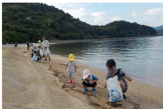
くまもと・みんなの川と海づくりデー