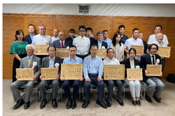
第3回くまもと環境大賞及び 第31回くまもと環境賞表彰式