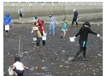
干潟どろんこ観察会

制作体験や自然観察会などのイベントを計15回実施しました（グリーンカーテンの設置、干潟どろんこ観察会、磯の生きもの観察会、万華鏡制作等）