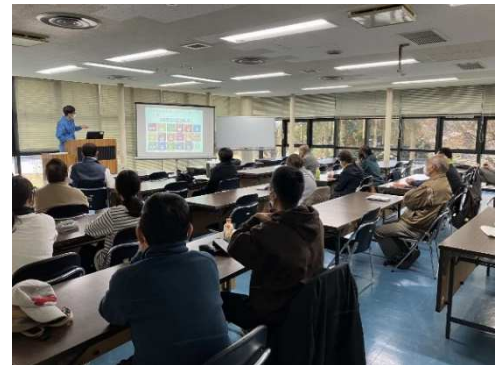
エコロジスト・リーダー養成講座