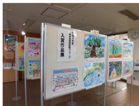
環境絵画コンクール展