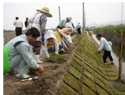
法面の管理の様子