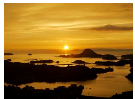
雲仙天草国立公園(高舞登山からの夕日)