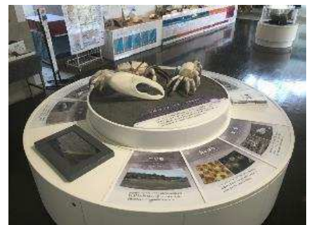
天草ビジターセンターのハクセンシオマネキに関する展示

令和3年度(2021年度)からは新たに国内誘客も強化するとともに、取組みの対象がすべての国立公園に拡