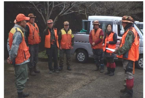
狩猟者のミーティングの様子