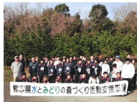
ボランティア団体による森づくり活動