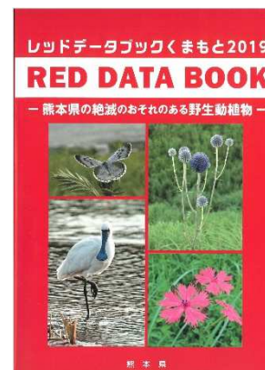
レッドデータブックくまもと2019

また、絶滅危惧種に対する県民の理解を深めるために、絶滅のおそれのある種を把握し、「熊本県の保護上重要な野生動植物(レッドデータブック)」を作成し公表しています。令和元年(2019年)には、10年ぶりに内容を見直した「レッドデータブックくまもと2019-熊本県の絶滅のおそれのある野生動植物-」を発刊しました。野生動植物をとりまく環境は変化していくものであり、定期的にレッドデータブック等の改訂を行うため、計画的に生息生育状況調査を継続し、絶滅のおそれのある種について引き続き把握に努めるとともに、県民への周知を図っています。