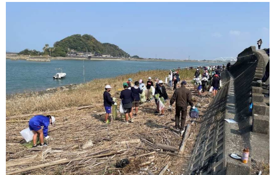
海岸での清掃活動

令和4年度(2022年度)のメイン会場での清掃活動は、新型コロナウイルス感染防止のため中止となりましたが、県内各市町村では式典の簡素化や規模縮小など実施方法を工夫して清掃活動が行われました。コロナ禍で、実施市町村、参加者数ともに減少していましたが、徐々にコロナ前の状況に回復しつつあります。