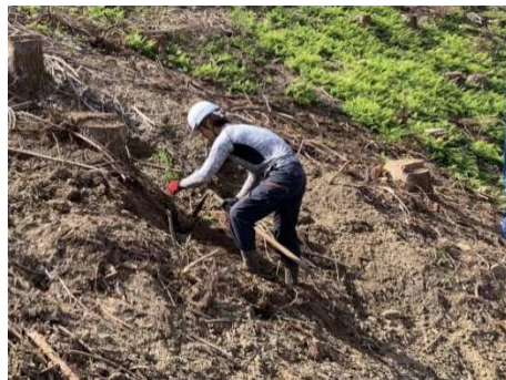
再造林作業の様子