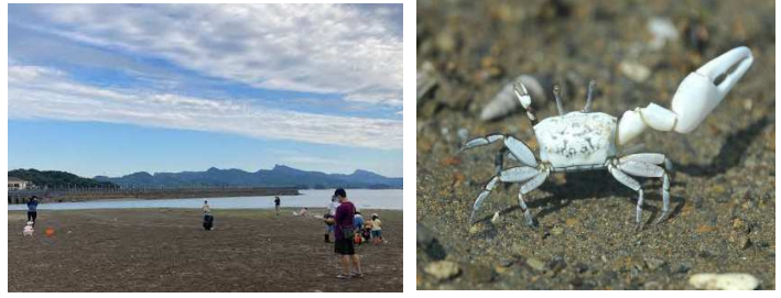
生物観察会の様子とハクセンシオマネキ