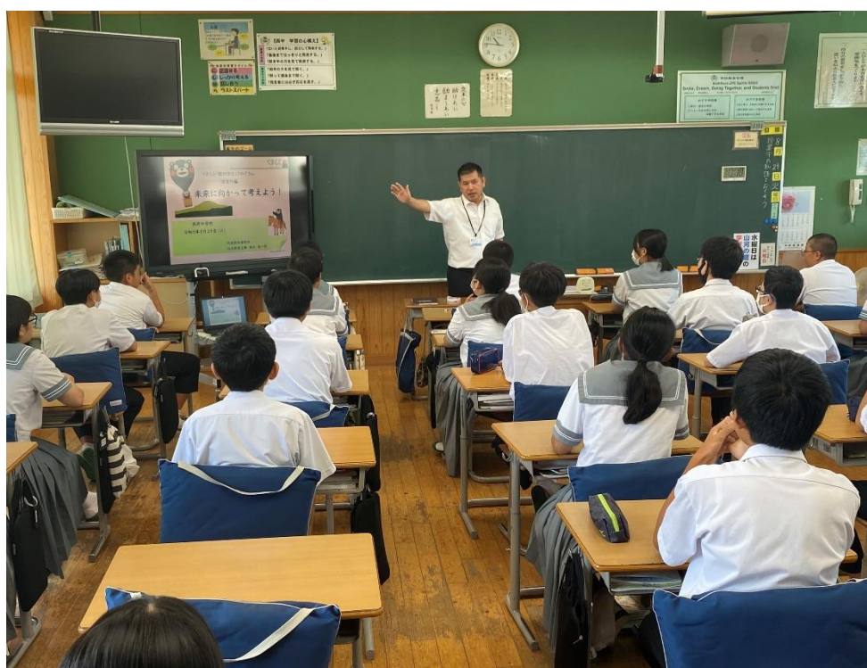
（西原村立西原中学校における次世代編講座の様子）