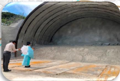
R5.10.2 トンネル安全祈願祭の様子